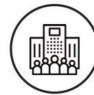
Industrie und Gewerbe